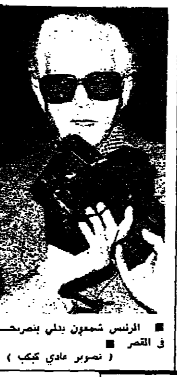
الرئيس شمعون بيلي بصرحه في القصر

غادر وزير الخارجية السوري السيد عبد الحليم خدام والوفدان ناجي جبيل وحكمت الشهابي بيروت أمس متوجهين الى دمشق بعد انتهاء المفاوضات السورية بتفويض قبيل مغادرتهم لبنان في حين أذيت معلومات رسمية جاء فيها : غادر الوفد السوري القصر الجمهوري عند الساعة العاشرة والربع قبل ظهر اليوم ( أمس ) بعد انتهاء جولة من المحادثات جرت في جو ودي وأخوي . وقبل سفر الوفد جرى اتصال هاتفياً بين الوزيرين عبد الحليم خدام وفؤاد بطرس عرضاً خلاله آخر التطورات ونتائج المحادثات السورية . أجرها الوفد السوري في لبنان . وعلمت « الانوار » ان الوفد السوري برئاسة السيد خدام الذي كان مدار بحث وتداول بين الرئيس ياسين سركيس ووزير الخارجية السوري السيد عبد الحليم خدام والوفدان ناجي جبيل وحكمت الشهابي هو ترتيب لقاء الرئيس ياسين سركيس وحافظ الأسد . وعلى هذا الصعيد اكدت مصادر موثوقة ان الرئيس اللبناني السوري سليمان في وقت قريب جداً لا يتجاوز اسبوعين وان لقاءهما سيتم بحضوره حالياً . خصوصاً العلاقات بين البلدين من زاوية كعنه اعاده بنسب الجيش والوثقة السورية بعد الانهاء من مرحلة شدة الإفاتات في الجنوب والتي من المنتظر كما قال مصدر حكومي ان « أس » للانوار » انه سيتم في غضون ايام قليلة لا تتعدى نهاية الاسبوع الحالي . التفويض يستغرق ثلاثة ايام عملية التنفيذ في لبنان اكثر من ثلاثة ايام وان دخول الجيش اللبناني الى الجنوب سيتم بعد ساعات قليلة من انسحاب القاتلين خصوصاً الفلسطينيين من مواقعهم الحالية التي مواقع حديتها لهم امانة القاهرة . وعلم ايضا من مصادر موثوقة ان اللقاء الذي تم بين الرئيس سركيس